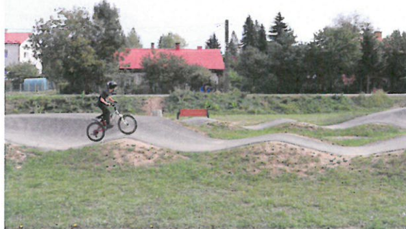
Tor rowerowy (Pumptrack)