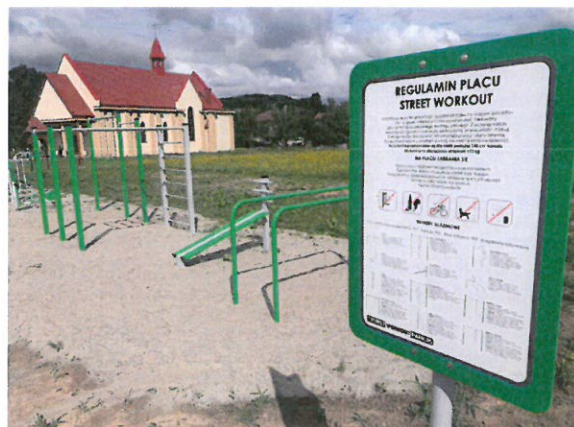
Siłownia na świeżym powietrzu