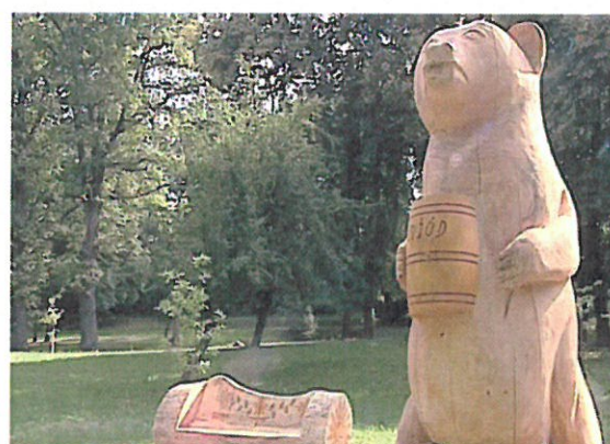
Rzeźby lokalnego twórcy