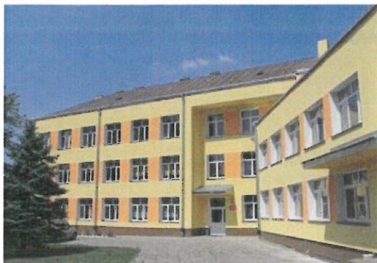
Szkola Podstawowa im. Armii Krajowej w Błażowej Dolnej