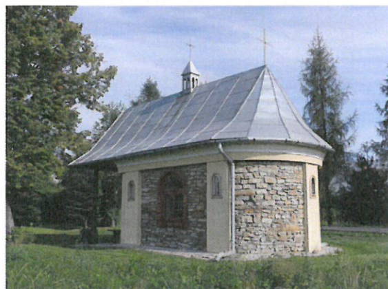
Zabytkowa kapliczka mszalna w Błażowej Dolnej