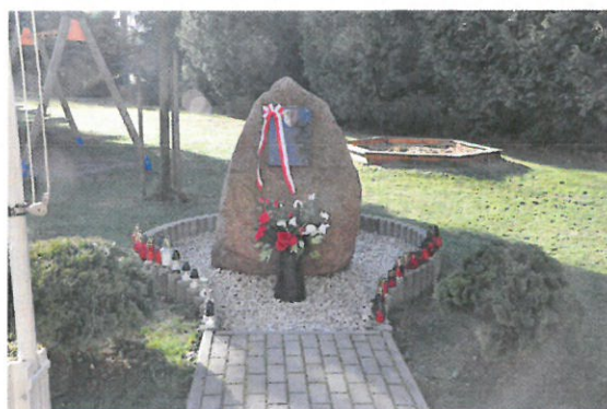
Obelisk Katyński z tablicą pamiątkową AK