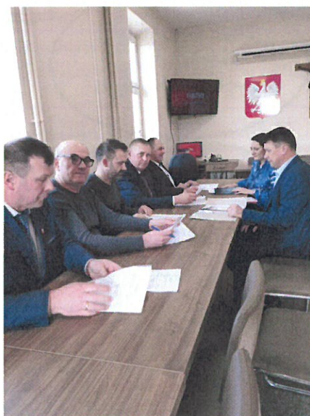
Warsztaty Grupy Odnowy Wsi

BLAŻOWA DOLNA - NASZA WIEŚ, NASZE MIEJSCE NA ZIEMI!