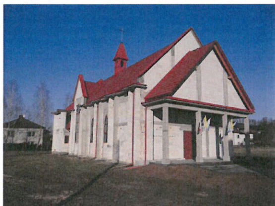
Kaplica mszalna p.w. św. Franciszka z Asyżu w Błażowej Dolnej