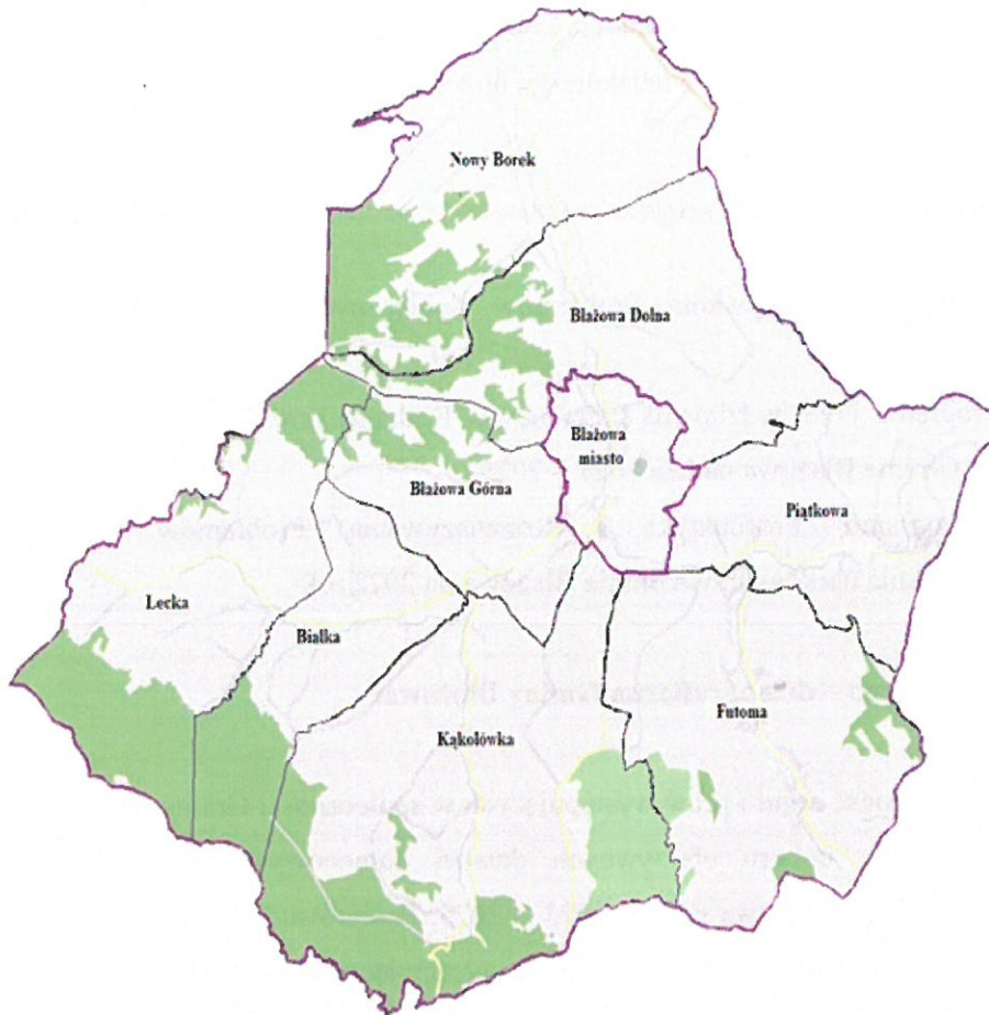
Rys. nr 1. Mapa Gminy Białowa.

Pod względem podziału kraju na jednostki administracyjne samorządu terytorialnego Gmina Białowa jest gminą miejsko – wiejską. Obszar gminy obejmuje całościową powierzchnię ponad 112,6 km 2 , z czego na miasto Białowa przypada – 4,24 km 2 , natomiast na przynależne do gminy wsie takie jak: Białka, Białowa Dolna, Białowa Dolna – Mokłuczka, Białowa Górna, Futoma, Kąkolówka, Kąkolówka – Ujazdy, Lecka, Nowy Borek i Piątkowa przypada – 108,36 km 2 .