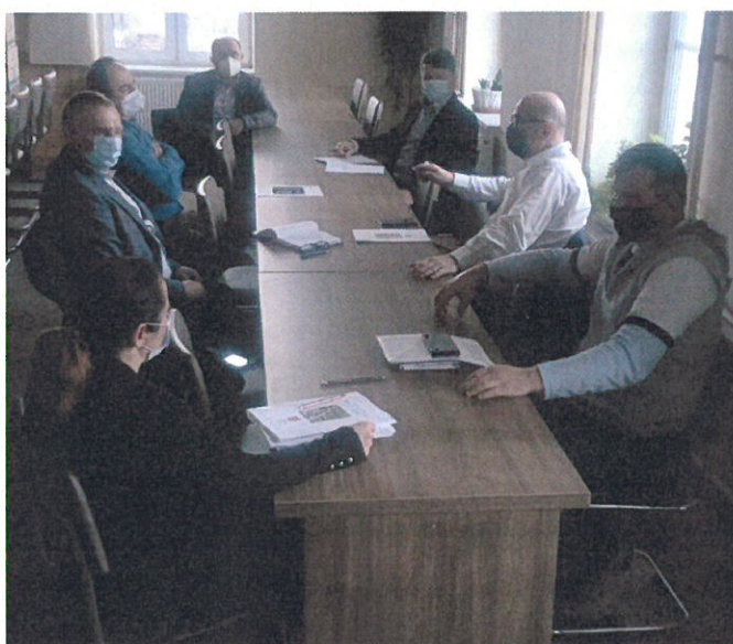
Warsztaty Grupy Odnowy Wsi

BLAŻOWA DOLNA - NASZA WIEŚ, NASZE MIEJSCE NA ZIEMI!