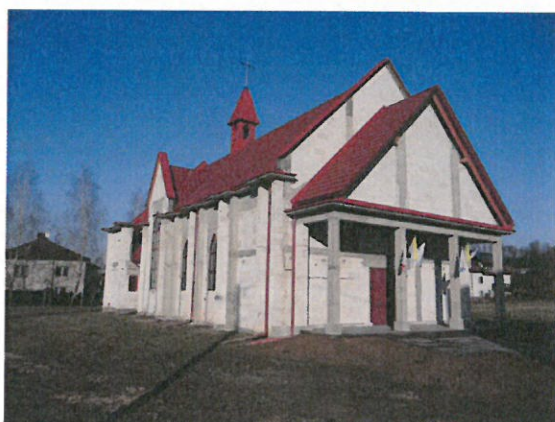
Kaplica mszalna p.w. św. Franciszka z Asyżu w Błażowej Dolnej