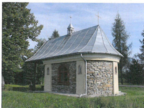
Zabytkowa kapliczka mszalna w Błażowej Dolnej