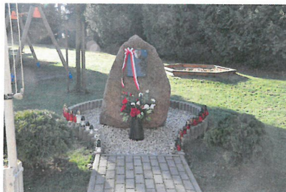
Obelisk Katyński z tablicą pamiątkową AK