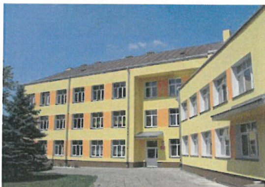
Szkoła Podstawowa im. Armii Krajowej w Błażowej Dolnej