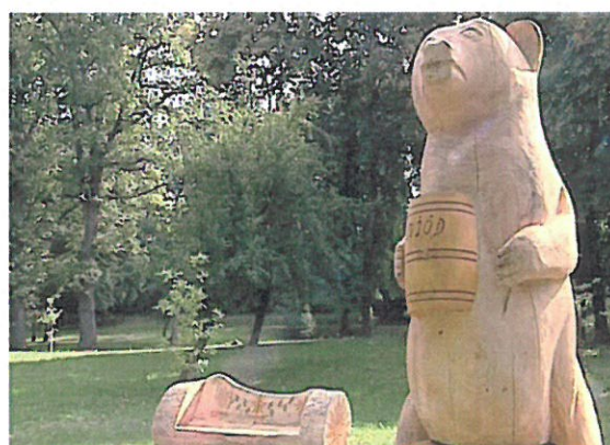
Rzeźby lokalnego twórcy